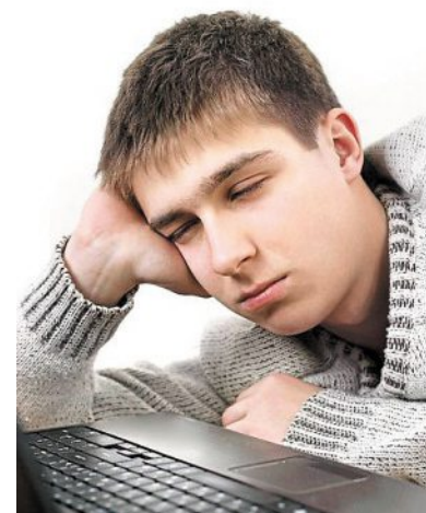
Il manque aux ados l'équivalent d'une nuit par semaine. (Photo d'illustration)