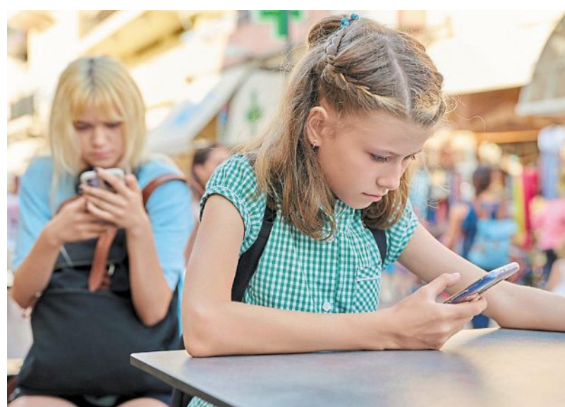
Des adolescentes utilisent leur smartphone.