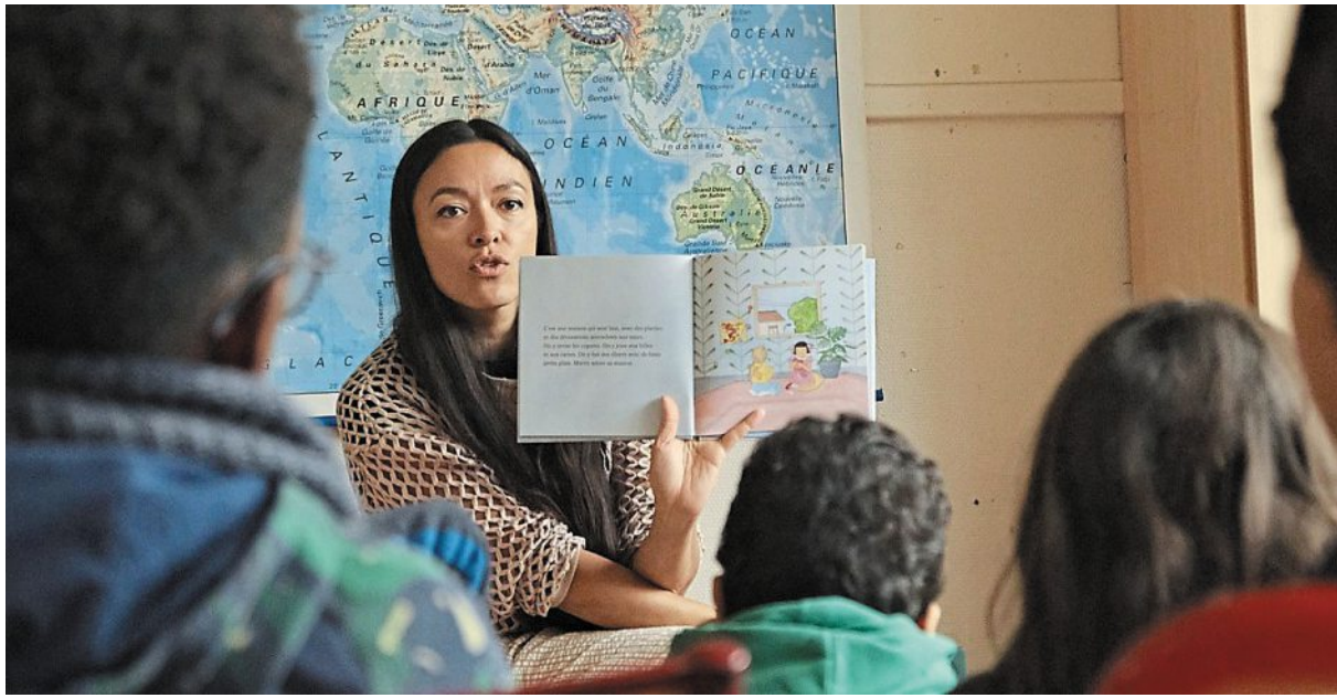
La lecture du « Loup » permet d'expliquer aux enfants comment agir en cas d'agression sexuelle.

« Comment ça va tout le monde ? » interroge-t-elle dès que les enfants l'ont rejointe avant de se présenter et d'expliquer son métier de chanteuse, « très pratique » pour exprimer ses émotions. Puis, elle leur parle d'une chanson en particulier. « Ça parlait d'une peur que je ne ressentais pourtant pas à ce moment-là. Et puis, j'ai compris. Cette émotion remontait à mes 7 ans dans la maison de mes grands-parents... » Elle prend alors son clavier et se met à chanter Le loup , instaurant un moment intime instantanément.