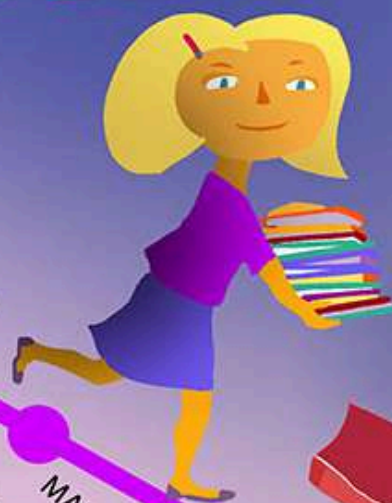
Illustration Grégoire Vallancien